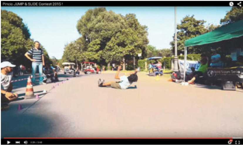
Fig. 10 Piazzale dei Martiri, performance dei pattinatori, still da video, https://www.youtube.com/watch?t=36&v=5fHNJ2f-mlo .