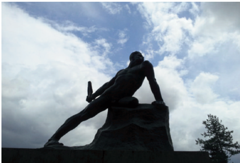
Fig. 8 Arturo Dazzi, Enrico Toti , 1919-22, bronzo.

sinistro è assestato con solidità muscolare sul blocco bronzeo che simula il bordo della trincea. Sul medesimo blocco è appoggiato l'arto amputato di cui appare un moncone ben visibile, prolungato da Dazzi rispetto a quello reale. La solidità bronzea, virile e vitalistica sembra cogliere plasticamente il motto attribuitogli in punto di morte in una delle versioni del suo decesso: "Nun moro, io!" (De Lorenzi 1993; Fabi 2005: 77-100, Laghi 2012: 42; Colbacchini 2010).