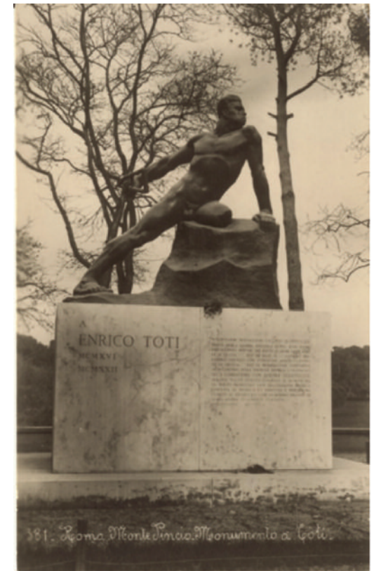
Fig. 7 Arturo Dazzi, Enrico Toti , 1919-22, bronzo, cartolina.

Il 6 agosto dello stesso anno, durante la sesta battaglia dell'Isonzo, che si concluse con la presa di Gorizia, Toti assaltò una trincea austriaca rimanendo ucciso. Secondo quanto riportarono i commilitoni sopravvissuti, il suo ultimo gesto fu lanciare la stampella contro il nemico.