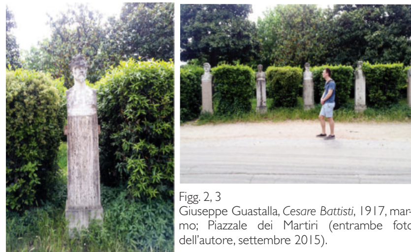
Figg. 2, 3 Giuseppe Guastalla, Cesare Battisti , 1917, marmo; Piazzale dei Martiri (entrambe foto dell'autore, settembre 2015).

settecentomila caduti doveva trovare in ogni caso una sua necessaria elaborazione. Si scelse la forma variegata del monumento ai caduti per risarcire il dolore delle madri, dei padri, delle vedove, degli orfani e venire incontro alle aspettative dei reduci, in un processo di mitizzazione del conflitto che è stato ben spiegato da George Mosse nella sua natura più articolata e profonda (Mosse 2002; Cresti 2006; Pisani 2011).