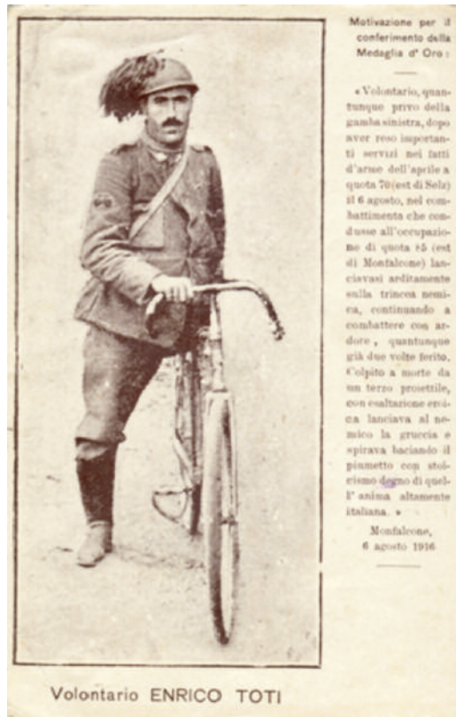
Fig. 6 Enrico Toti, ciclista bersagliere, ritaglio di giornale, 1916.

sandria d'Egitto raggiunse il confine con il Sudan dove le autorità inglesi, giudicando troppo pericoloso il percorso, gli imposero di concludere il viaggio e lo rimandarono al Cairo da dove fece ritorno in Italia. Eroico invalido del lavoro Toti con le sue imprese avventurose, era riuscito a ritagliarsi una certa celebrità popolare, amplificata dalla straordinarietà del suo stato di menomazione fisica (Fabi 2005). Allo scoppio del conflitto mondiale, essendo state rigettate le sue richieste di arruolamento, raggiunse comunque il fronte nei pressi di Cervignano del Friuli, dove fu accolto come civile volontario e adibito ai "servizi non attivi". A seguito di un controllo fu però obbligato a tornare alla vita civile. Nel 1916, per interessamento del Duca d'Aosta, sfruttando la sua popolarità, riuscì a superare l'ostacolo della mancanza dell'arto facendosi arruolare nel corpo dei ciclisti bersagliere [Fig. 6].