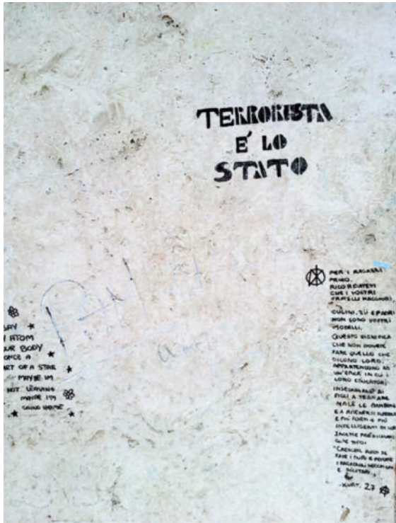
Fig. 9 Enrico Toti, dettaglio retro del monumen- to (foto dell'autore, settembre 2015).

per gli atti di vandalismo. Il monumento a Toti, probabilmente per la sua celebrità e dimensione, resta invece oggetto di interventi di graffitismo ricorrenti come quello recentemente documentabile sul retro del piedistallo in travertino [Fig. 9]. Un anonimo estensore, che si firma con la A cerchiata anarchica, sembra fare esplicito riferimento nel lungo testo trascritto, alla sfera eroica del monumento, citando una pagina dei diari di Kurt Cobain, leader del gruppo rock/grunge Nirvana, morto suicida nel 1994: