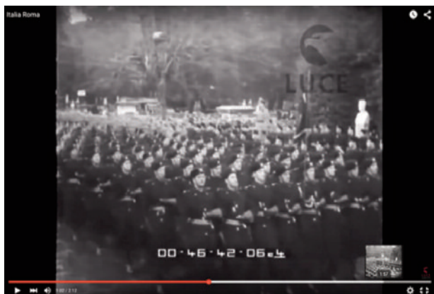
Fig. 1 Giornale Luce B1465 del 22 feb- braio 1939, still da video: https://www.you- tube.com/watch?v =drMzOISacyo

re e non marcire” [Fig. 1]. “La guerra, futurismo intensificato”, oltre ai militi e ai civili, aveva lasciato sul suolo numerosi intellettuali ed artisti a cui si era rivolto il “Manifesto del teatro sintetico”, con il suo incitamento anti-passatista: “non marcire nelle biblioteche e nelle sale di lettura” (Marinetti 1915; Nazzaro 1987: 130). 2 Virilità militante, velocità contro l’immobilismo, eroismo, nazionalismo e glorificazione della guerra erano stati gli ingredienti dell’interventismo italiano (Isnenghi 2007; Calì 2007).