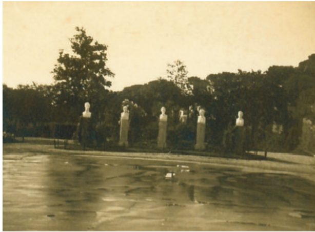
Fig. 4 Piazzale dei Martiri tratta da http://www.monumentigrandeguerra.it/dett.aspx?ID=2591&CP=5&ReportUrl=http%3a%2f%2fwww.monumentigrandeguerra.it%2fricerca.aspx%3ftxtlibera%3dRoma%26cp%3d1