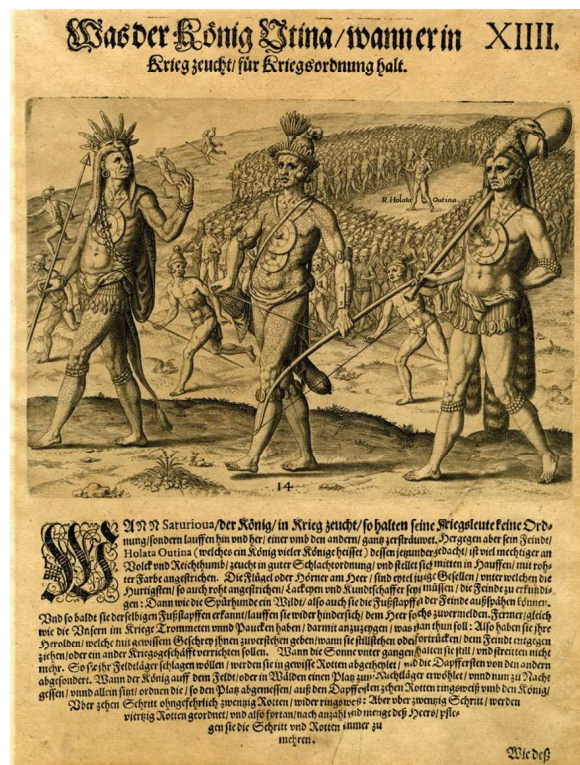
Fig. 3 | Dagli archivi di stato della Florida: un'altra incisione di de Bry, questa volta sui timucua, tratta dal medesimo volume delle figg. 1 e 2. Si notino in primo piano i tatuaggi del personaggio al centro, e di quello a sinistra. Va da sé che, per quanto indubbiamente eccentrici agli occhi di un europeo del tempo, solo con un certo sforzo questi disegni potrebbero considerarsi così complessi e astrusi come da descrizione di Montoya: ulteriore prova del fatto che sono, anzitutto, un espediente (meta)narrativo. Il titolo, "Was der König Utina, wann er in Kriegszeug ist, für Kriegsordnung halt", recita in italiano: "Come il re Utina, quando va in guerra, mantiene l'ordine militare".

sembrava incarnare il luogo di tutte le rappresentazioni. Guardando i disegni sotto l'ampia ombra degli alberi, a ridosso di un fiumiciattolo da cui gli indios attingevano l'acqua per i loro pigmenti, Le Moyne si sentiva folgorare, come se quelle migliaia di tratti da cui veniva precipitosamente in-