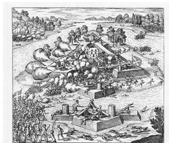
Fig. 2 | Un'altra incisione di de Bry su Fort Caroline, dallo stesso volume della fig. 1.